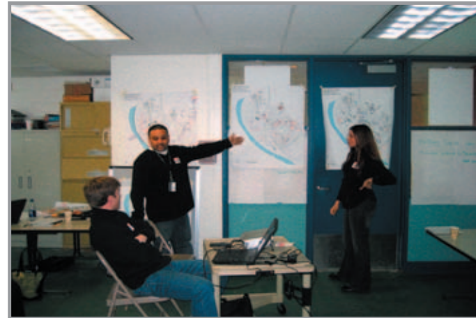
MIT and NEON discussing the campus plan

. . . walking through Thomas Street Placita, one immediately notices the colorful mural above the entrance of the Gerena School. Just below the mural lies a marquee announcing the latest production of the Gerena School theater. The school entrance itself boasts an art gallery, and people linger around the entrance awaiting an opening. Kids play in the grass and flowers bloom on the sides of the new “Thomas Street” . . .