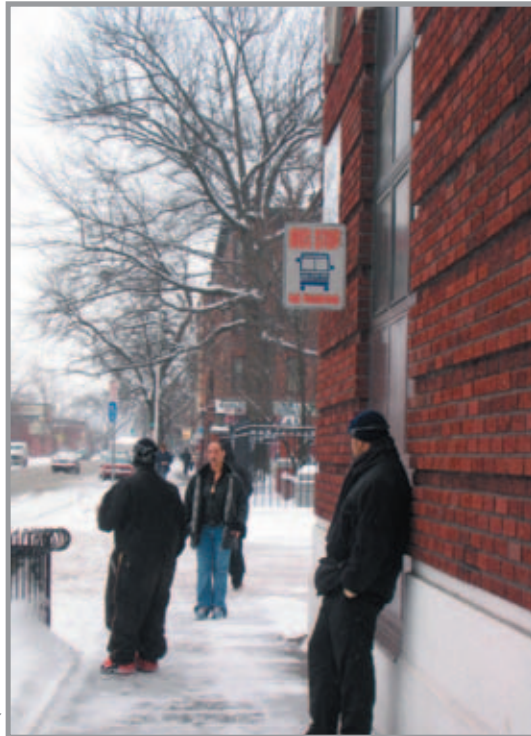
Waiting for the bus on Main Street

The Plan also divides the campus project into three physical areas: Plainfield Gateway, the Thomas Street Passage through the Gerena School, and Thomas Street Placita. These three physical areas together establish an important link buttressed by two vital gateway spaces which draw activity onto Thomas Street. The two gateways link the rest of the North End to the Campus, connecting the neighborhood to its assets and resources while also linking the two halves of the North End.